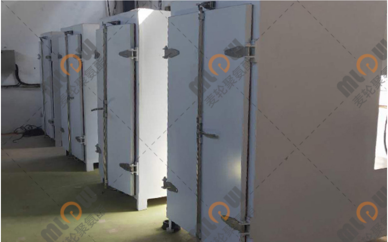
( 物流设备导向轮 )

麦轮聚氨酯制品是一家集聚氨酯制品设计、研发、生产等一体的一站式厂家，主营：聚氨酯包胶轮、聚氨酯轮、高分子包胶轮、重载聚氨酯轮、堆垛机聚氨酯轮、智能物流驱动包胶轮、AGV小车辊轮、麦克纳姆轮、汽车生产线包胶轮等聚氨酯产品，囊括汽车制造、智能物流仓储运输等多个行业。