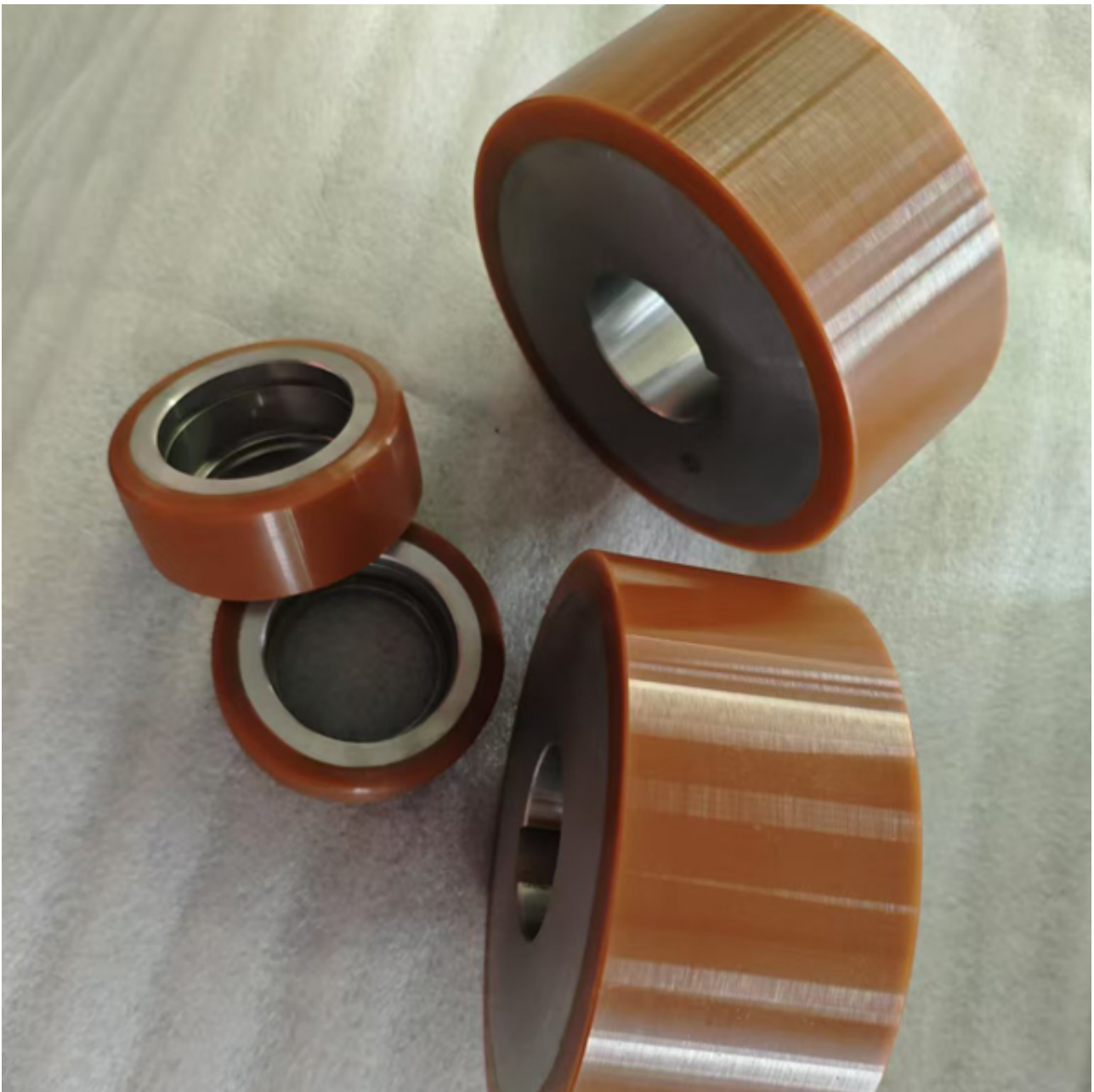
AGV小车聚氨酯防滑轮

5、耐腐蚀性：聚氨酯轮在机油、润滑油、酸碱盐等化学物质下几乎不受侵蚀，适应仓储环境中可能存在的各种腐蚀性物质。