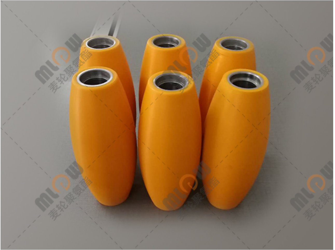
（中型负载麦克纳姆轮）