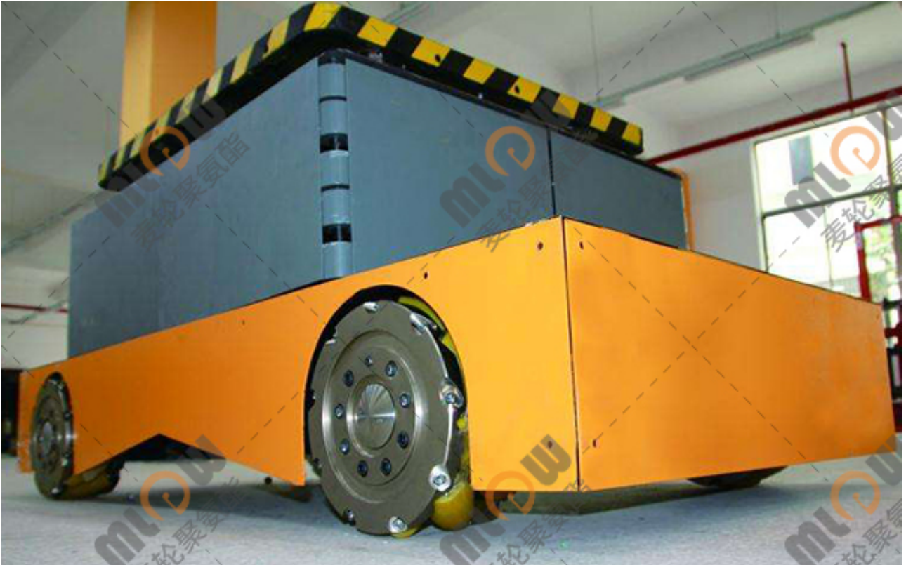
( 10寸麦克纳姆轮 )