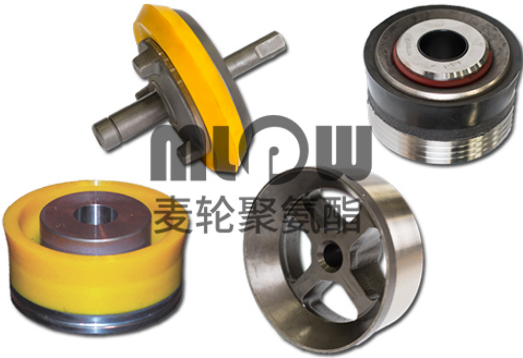
聚氨酯活塞密封件