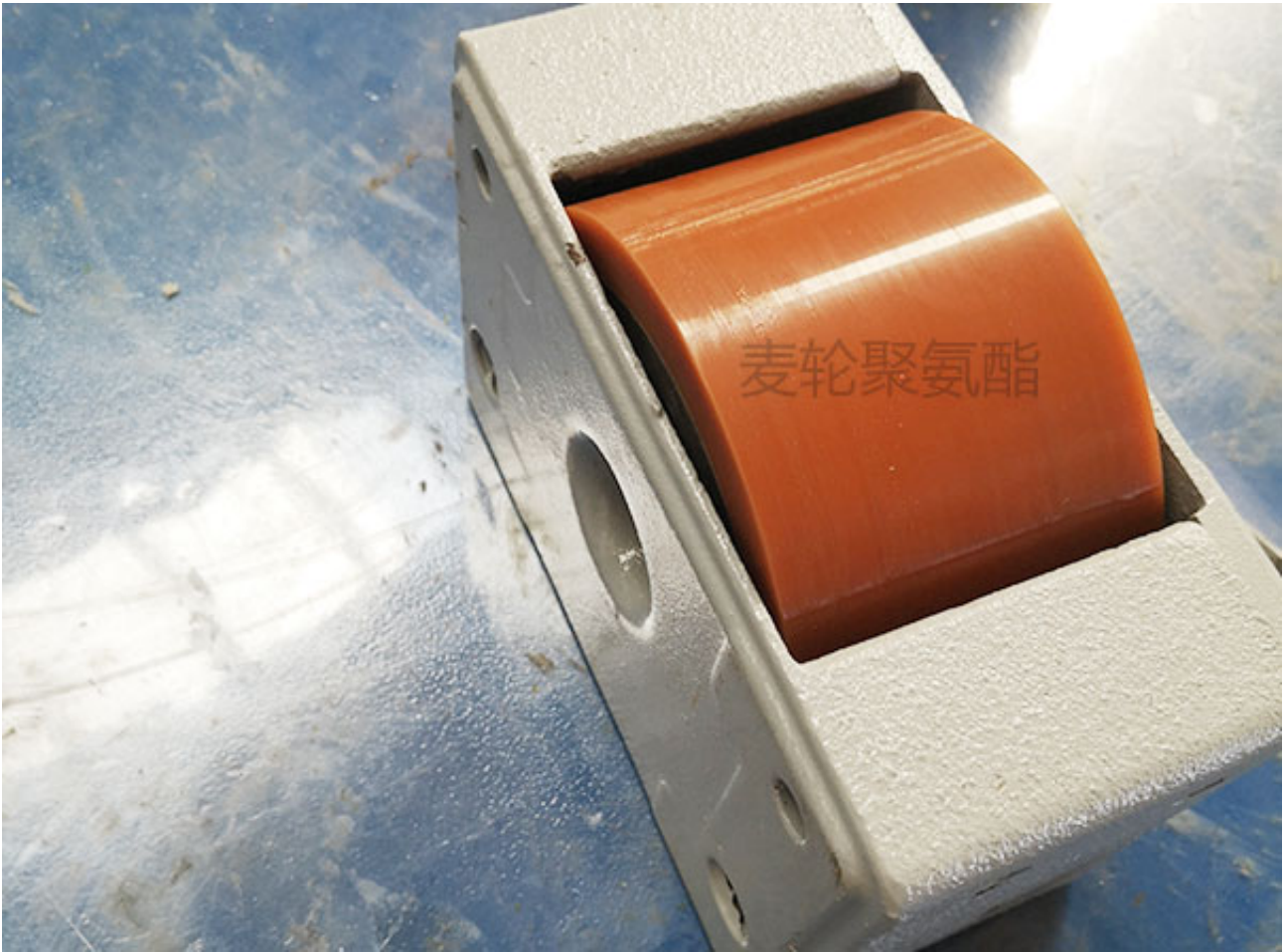
聚氨酯起重机行走轮箱