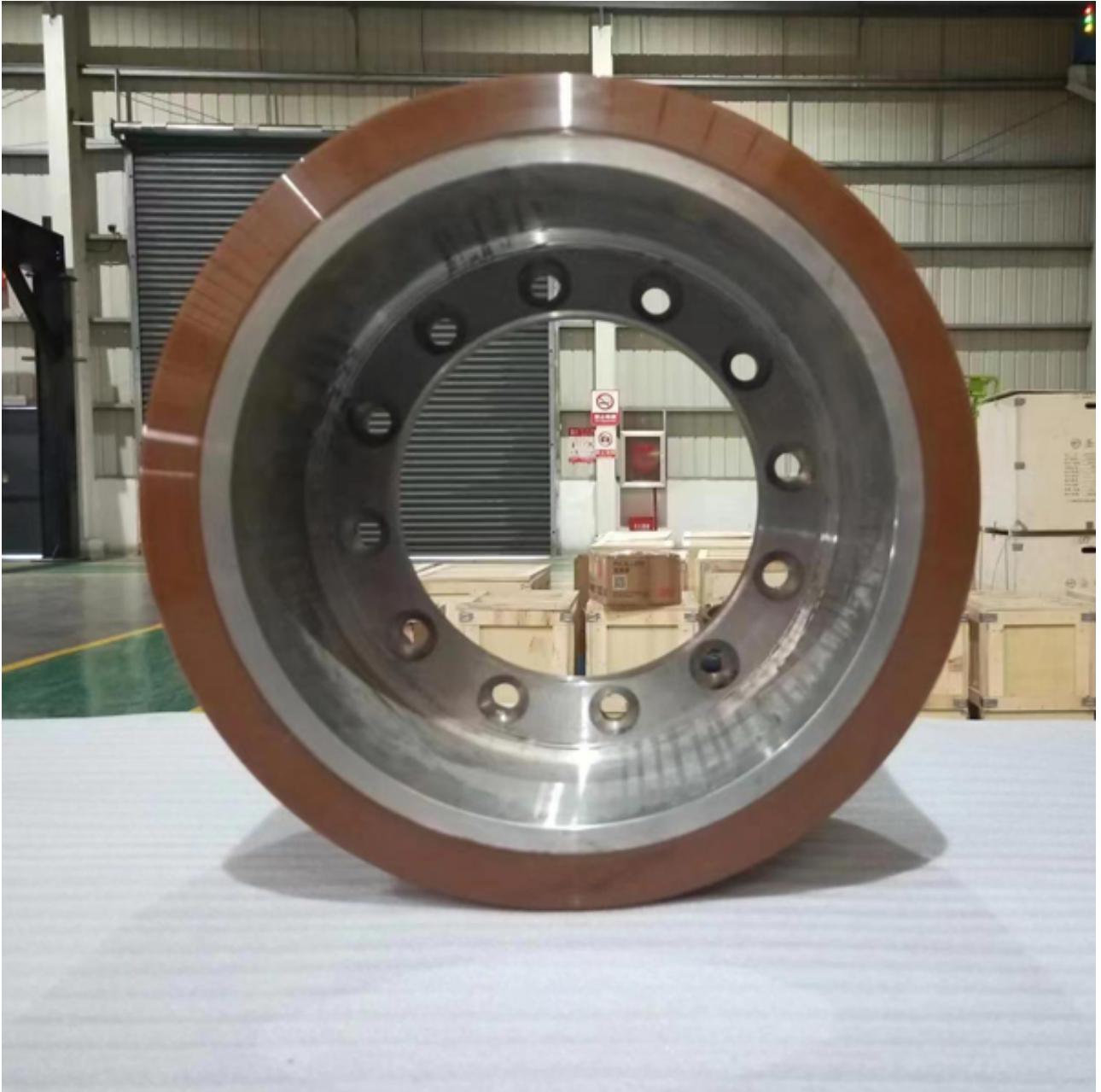
重载聚氨酯包胶轮