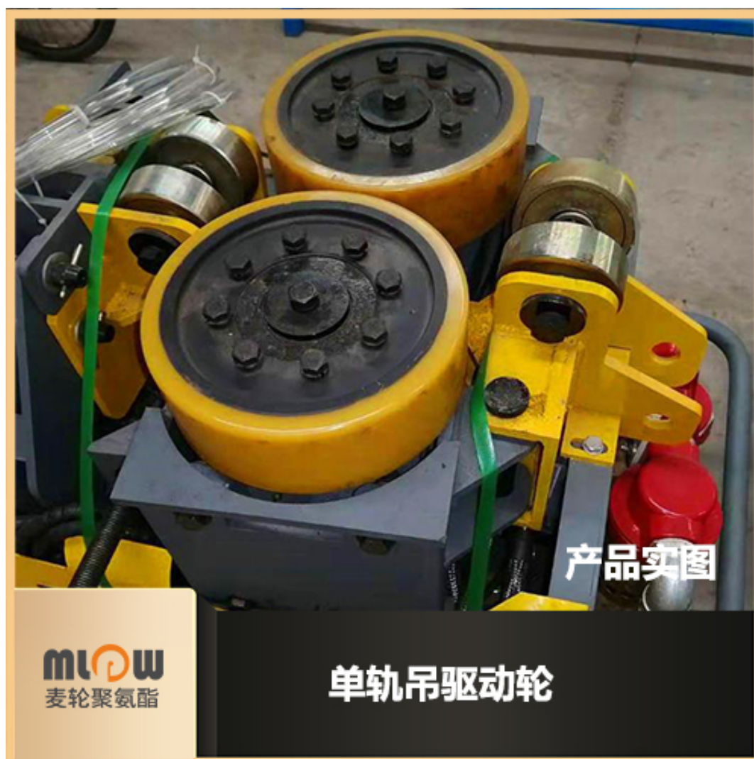
矿用单轨吊驱动轮图片

多种优点，使单轨吊驱动轮使用聚氨酯包胶是煤矿输送设备好的选择，同时也得到广泛应用。